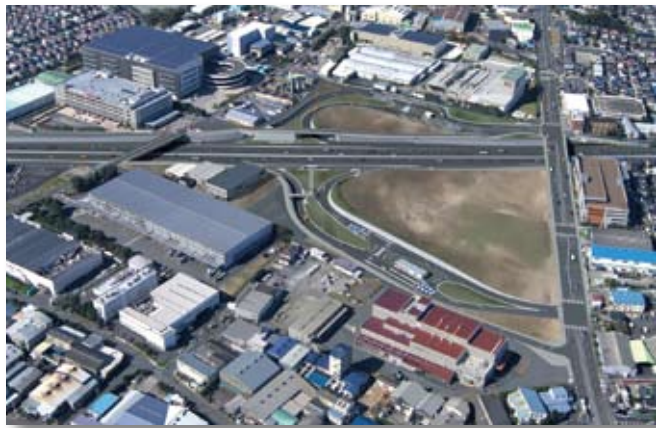
(仮称) 綾瀬スマートインターチェンジ完成予想図

私は、市長就任以来、少子高齢化や人口減少社会の中で、綾瀬市が将来に向けて持続可能な都市として発展していくことを目指し、市民の皆様と一緒に、誠意、市政に取り組んでまいりました。